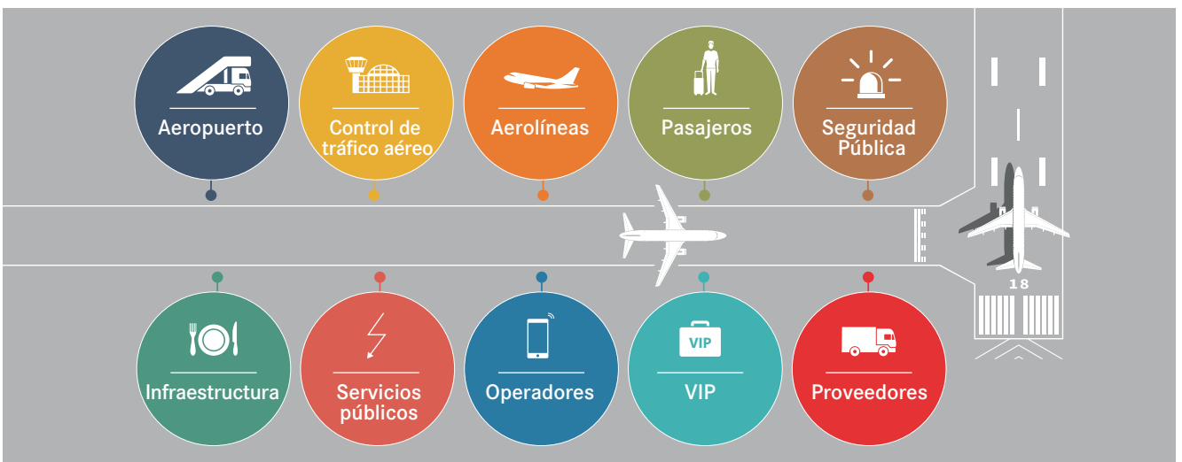
Usuarios del espectro radioeléctrico

Los requisitos y los servicios de los aeropuertos aumentan constantemente, así como la demanda de comunicaciones radioeléctricas terrestres y aéreas. Existen distintos tipos de servicios inalámbricos. Los más conocidos son los utilizados por los operadores móviles para servir a sus usuarios, pero también existen muchos otros, por ejemplo, los servicios vinculados al control de tráfico aéreo (ATC, por sus siglas en inglés), la seguridad pública, los servicios de los espacios exteriores e interiores de los aeropuertos inteligentes para los sistemas logísticos, de control de flujo de pasajeros y despacho de equipaje, así como otras aplicaciones de la IO. Todos estos servicios dependen de comunicaciones inalámbricas y requieren de espectro tanto dentro de los aeropuertos como en sus alrededores.